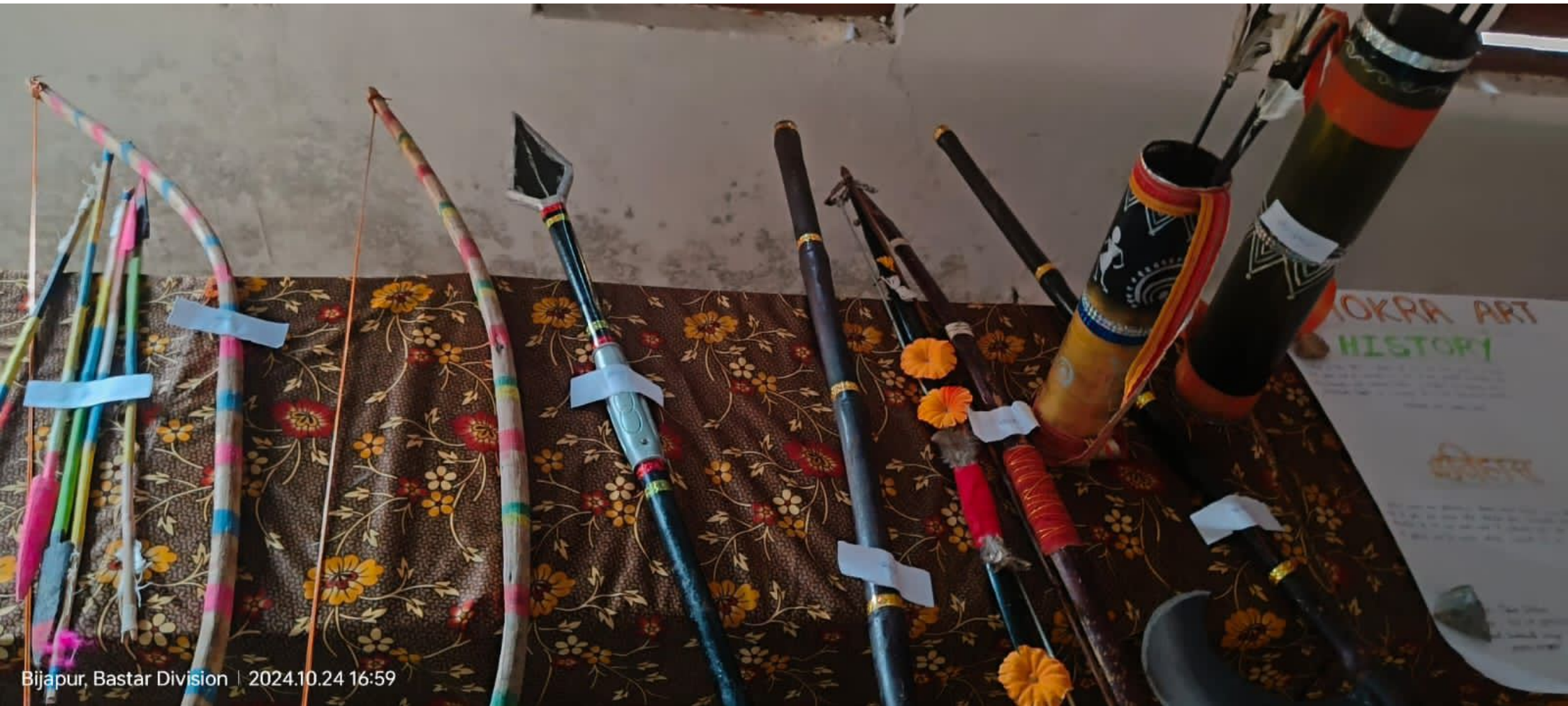
Bijapur, Bastar Division | 2024.10.24 16:59