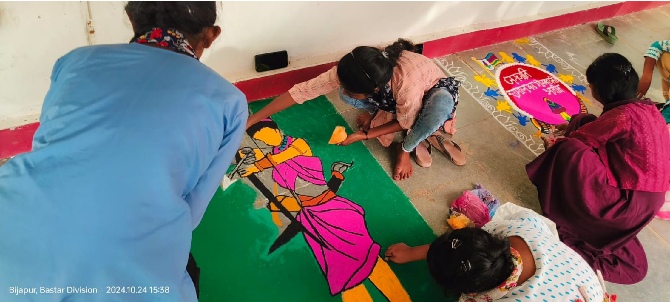
Bijapur, Bastar Division | 2024.10.24 15:38